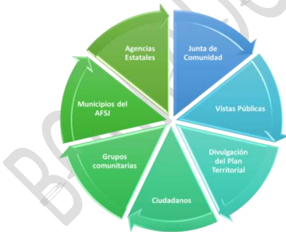
Ilustración 1: Proceso de Participación Ciudadana